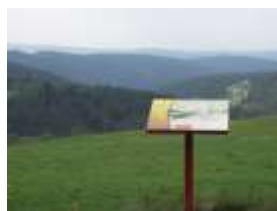
Exemple de panneau thématique le long du chemin